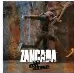
NO HAY VUELTA (Carejada Records, 2020)