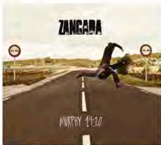
MURPHY 14:20 (Rock Estatal Records, 2017)